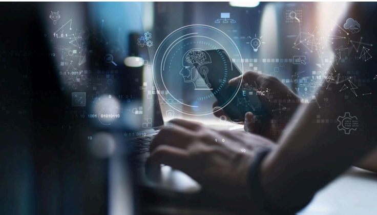
Inteligencia artificial