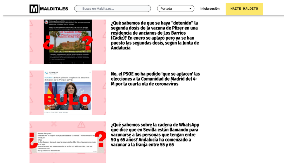
Imagen 14: Captura de pantalla que muestra los ejemplos de sus publicaciones.