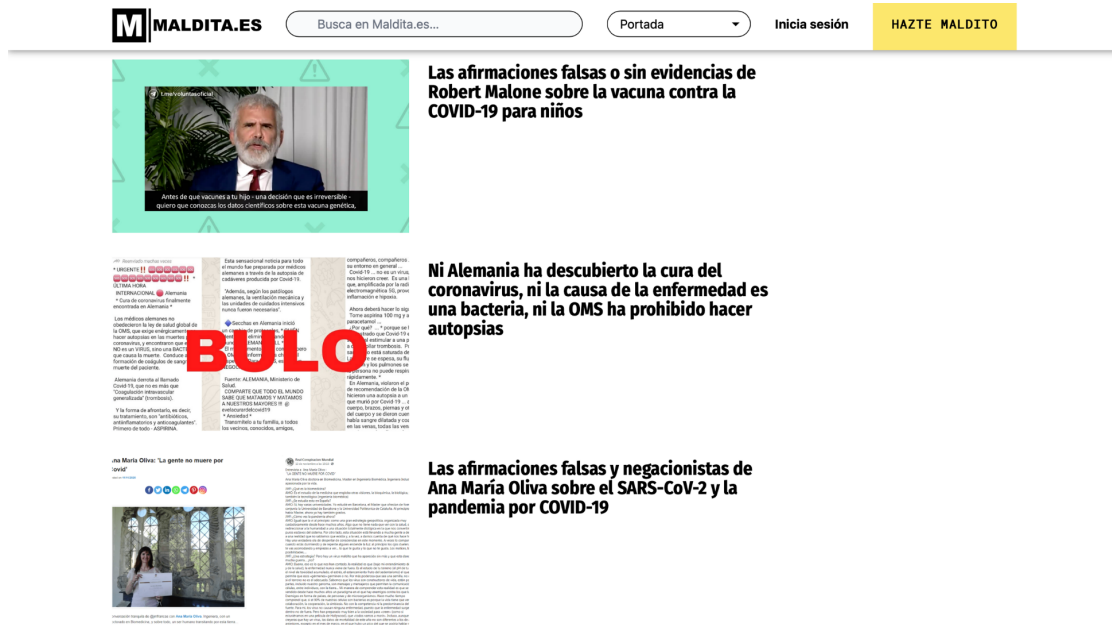
Imagen 15: Captura de pantalla que muestra los ejemplos de sus publicaciones.