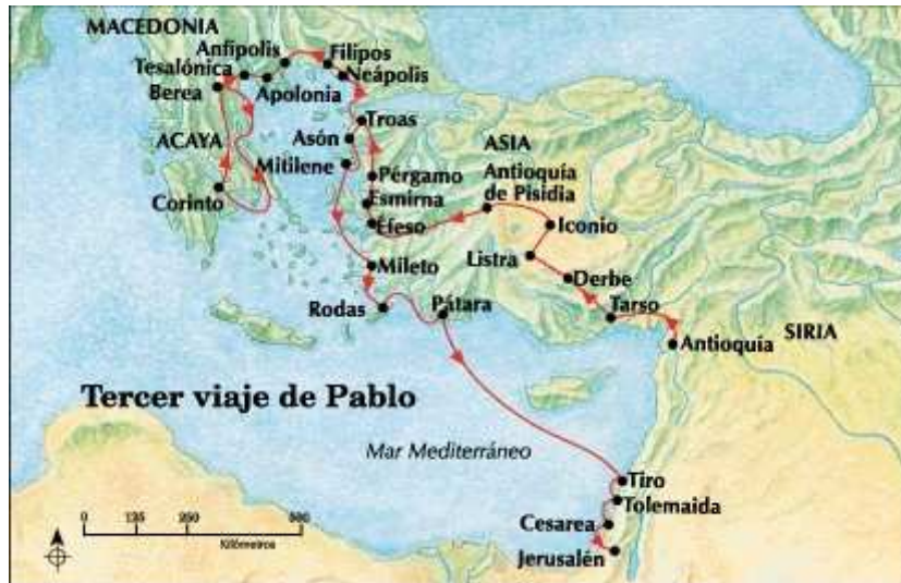
Tercer viaje misionero de Pablo. 165