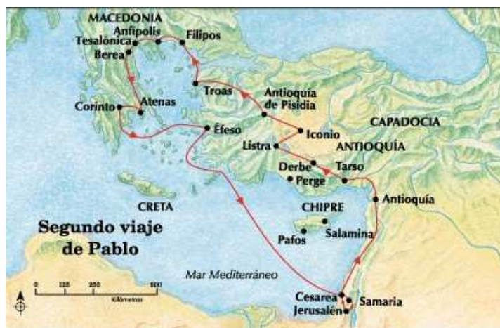
Segundo viaje misionero de Pablo. 158

Su mensaje fue recibido con alegría por los oyentes, quienes tal vez fueran tanto gentiles como judíos, y lo invitaron a quedarse más tiempo. Sin embargo, Pablo decidió seguir su viaje, prometiéndoles regresar si le era posible. Tomó un barco hacia Cesarea dejando a Aquila y a Priscila en Efeso, sin duda para seguir la obra que él había comenzado allí. Desembarcó en Cesarea, visitó brevemente Jerusalén para saludar a la iglesia y luego siguió hacia Antioquía, donde había comenzado sus giras misioneras (vs 19-22). Así terminó su segundo viaje misionero, que duró aproximadamente tres años , quizá desde la primavera del 51 hasta septiembre u octubre del 53 dC . 157