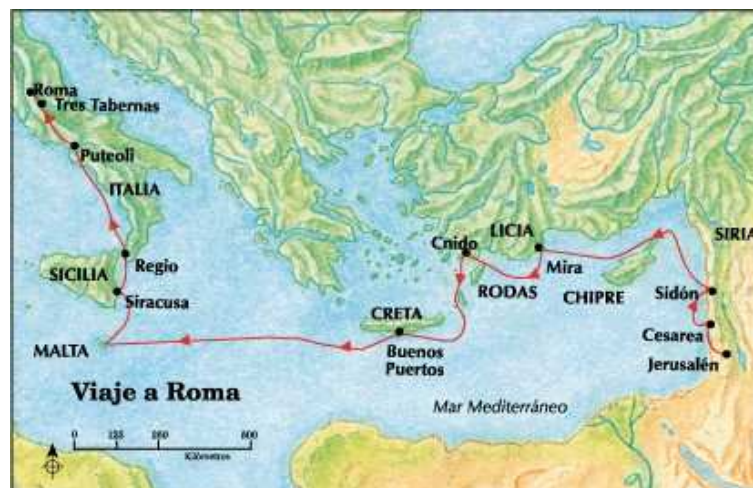
Viaje a Roma de Pablo. 167

Cuando Pablo y sus acompañantes llegaron a Jerusalén 166 fueron recibidos alegremente por los cristianos del lugar. El informe que dio a los dirigentes de la iglesia, con respecto a la difusión del evangelio entre los gentiles, produjo gran regocijo. Sin embargo, al mismo tiempo los líderes le contaron que circulaban informes de que estaba instando a los cristianos judíos helenistas, como también a los conversos gentiles, a no seguir la circuncisión y las demás leyes de Moisés (Hch 21:15-21).